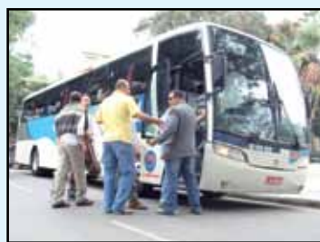
Sindicato fretou ônibus para o Rio

Os representantes dos estados do Rio e Espírito Santo na Conferência Nacional foram eleitos na Conferência Interestadual, dia 27 de junho, no Rio. Como apoio de deputados como o federal Chico Alencar (PSOL-RJ), o estadual Rodrigo Neves (PT-RJ) e o estadual Gilberto Palmares (PT-RJ), o evento definiu reivindicações e estratégias.