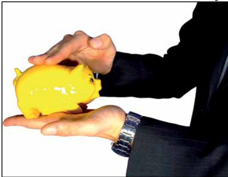
Cheques serão entregues nas agências aos sindicalizados interessados

De 1º a 31 de agosto, dirigentes do Sindicato percorrerão as agências para recolher cópia do contracheque dos sindicalizados interessados em receber de volta a contribuição sindical, descontada em março de todos os trabalhadores. O recebimento será no mês de setembro, em cheque administrativo entregue pelos sindicalistas.