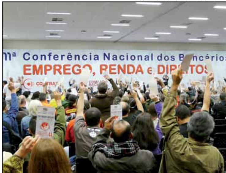
Os bancários votaram todas as reivindicações da minuta da Campanha

Seguindo o modelo dos últimos anos, a Campanha será unificada entre bancos públicos e privados, com negociações específicas por banco.